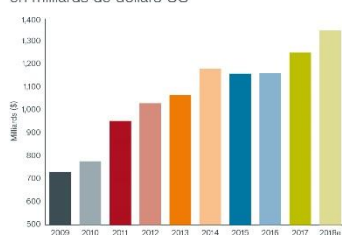
Dividendes au niveau mondial, en milliards de dollars US