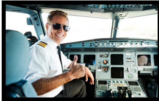
Gérant d'aujourd'hui ?