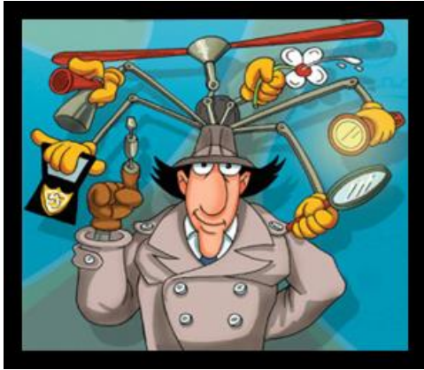
Gérant d'avant ?